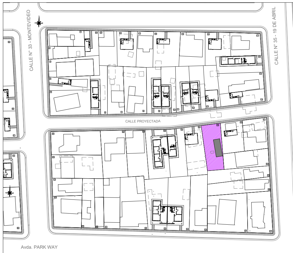
Plano de ubicación esc. 1.1000